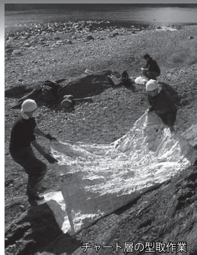
チャート層の型取作業