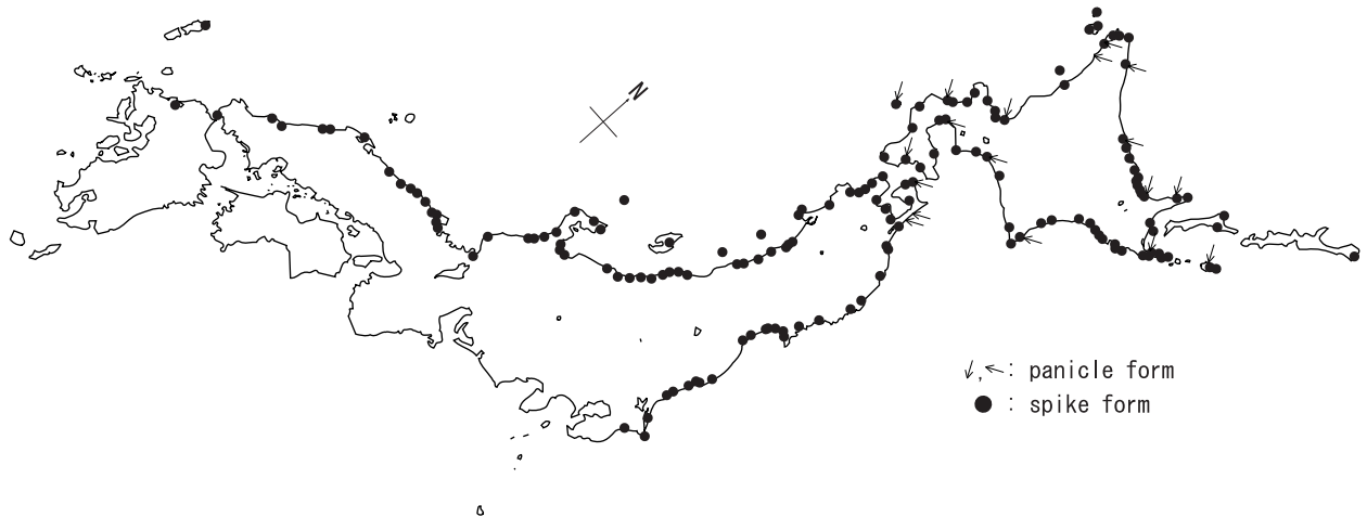
図3. 分布図. Fig. 3. Distribution of Leymus .

図3は、採集地名が特定できた338点 (spike form 311点とpanicle form 27点) をプロットした分布図である。これまでハマニンニクは北海道から九州北部まで分布するとされてきたが (Honda, 1930, 大井, 1941; 1965; 1982, 小山, 1964, Koyama, 1987, 長田, 1993) spike formは、その全域で採集されていた。一方、panicle formの採集地は、北海道の各地と青森県の下北半島に限られていた。