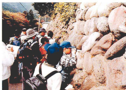
コケウォッチング(11月11日)。