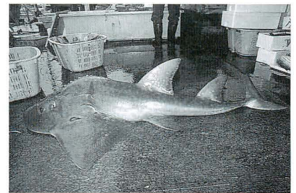
図1. 相模湾では珍しいシノノメサカタザメ (根府川産).

相模湾の魚類相の全貌を明らかにするためには、1) 過去の記録を漏れなく整理してデータベース化すること、2) 博物館などで未報告のままになっている資料を調査すること、3) 調査の網の目から漏れている魚を効率よくピックアップすることなどが重要です。3) については、スキューバダイビングによる採集調査と平行して、ダイバーが撮影した魚の水中写真をデータベース化することが最も有効な方法と考えています。もちろん、伊豆・小笠原諸島や南日本の黒潮沿岸域など、比較地域の魚類相の調査を同時に進めることも重要です。日本の動物学発祥の地として、長い研究の歴史を背負う相模湾ですが、魚類相については、まだまだ未知の部分が多いようです。