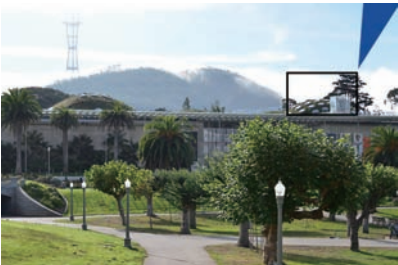
図7 ゴールデンゲート公園に建つカリフォルニア科学アカデミー。かなり凝ったエコロジカル・デザイン。

展示では、恐竜の豊富さ、復元骨格の動き、組み合わせなど、古生物展示がとても良くてきていました。収蔵庫はガラス窓で公開されており、たくさんの恐竜化石が収蔵されていました。庫内の照明が消せないで退色しない化石が適しているのでしょう。また、DNA展示コーナーは二重らせんで取り巻かれた外観も良いし、その一部を利用した遺伝情報転写パズルもあり、楽しい展示だと感じました。