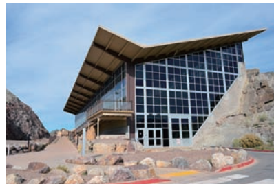
図3 展示館。ボーンベッドの露頭に建物がかぶせてある。

この博物館があるハンコック公園内にはタールの池があちこちにあり、数カ所で発掘が行われていました。数立方メートルのブロック状に切り出されたものがいくつも置かれています。掘り下げた部分ではタールがしみ出しており、くみ上げながら作業が行われるようです。