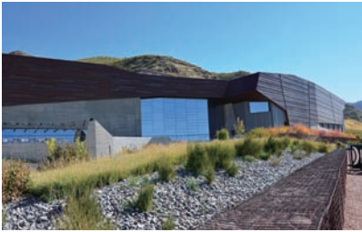
図6 ユタ大学自然史博物館。背後の山へつながる傾斜地を利用した建物。

た。展示では、恐竜よりむしろ哺乳類のコレクションが、すばらしい質でした。収蔵庫とラボをこれから増築する計画が貼り出されていました。庭の恐竜模型(図5)は、なくてもよいと思いました。