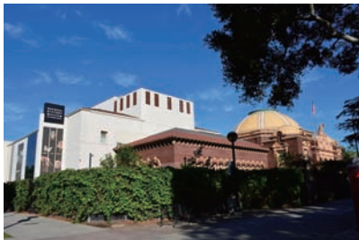
図1 ロサンゼルス郡立自然史博物館。左奥が本館、右手前が旧館の建物。

10月にアメリカ合衆国西海岸の自然系博物館とユタ州の恐竜産地を訪ねる機会を得たので、紹介したいと思います。