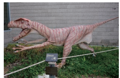
図5 ユタ州立公園自然史博物館のユタラプトル復元模型。他にもたくさんある。

今回訪ねたのは展示館(図3)と隣接する化石の小径 Fossil Discovery Trail(図4)だけです。展示館に入ると後ろ向きのアロサウルス Allosaurs が足跡とともに迎えて。そして右には大露頭が! 子どもの頃から図鑑で見ていたあの bone bed(骨化石密集層)! いつか見たいと夢見ていたのです。しばらく眺めてから2階のバルコニーへ移動し、単眼鏡で観察しました。ふと業務を思い出し、写真を撮りました。これらは企画展「恐竜の玉手箱」(22ページ参照)で展示します。ここではステゴサウルス Stegosaurus とカマラサウルス Camarasaurus が多いことやその位置をタッチパネル上で解説しています。その後外へ出て化石の小径を歩きました。そこではスタンプ層、モリソン層(展示館の地層)、モウリー層を観察できると説明されています。すぐに終わってしまい地層の薄さに驚きました。有名な地層だから厚いという訳ではないし、厚さも均一ではないのですが、もっと厚い思い込んでいました。展示館内の地層に比べると、化石は少ないのですが、ちょっと見ただけで恐竜の骨片が見つかるし、四肢骨や椎骨も見つかります。恐竜だらけで、独り大興奮! でした。