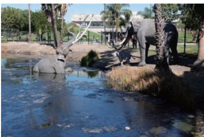
図2 タール池にはまったコロンビアマムモス(模型)。奥がページ博物館。

Natural History Museum of Los Angeles County(図1):ロサンゼルス中心部に近く、サイエンス・センターやローズガーデンに隣接しています。エントランスにはティラノサウルス Tyrannosaurus とトリケラトプス Triceratops があり、恐竜ホールにはティラノサウルスが3体も展示されています。これらは約2歳(全長3.3m)、約13歳(同6m)、約17歳(同10m)と推定されており、その成長の速さがうかがえます。このような展示は世界でもここだけでしょう。哺乳類展示室2階のバルコニーにはネオパラドキシア Neoparadoxia の復元骨格があり、タッチパネル形式で骨を発掘したり、それをはめ込んで骨格を復元したりする体験ができます。建物の周囲はミニ植物園になっていました。堆肥のできかけ3段階を手で掘らせてみたり、セージの葉に触ってにおいをかぐように促す看板があったり、体験の仕掛けがたくさんありました。