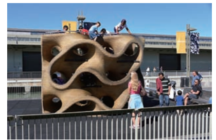
図10 ジャングルジムの穴あき木製遊具。まるでフナクイムシになったよう。