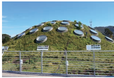
図8 図7の右上口部分の拡大。丸窓は館内の熱帯雨林スフィア(球体)の採光部になっている。

California Academy of Science : ゴールデンゲート公園の中にあり、水族館、植物温室、プラネタリウム、自然史博物館からなる複合研究普及機関です。エ