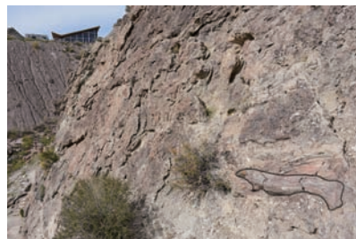
図4 化石の小径にあるモリソン層の竜脚類の大腿骨(輪郭強調)。層理面を延長すると左奥の展示館の露頭につながる。