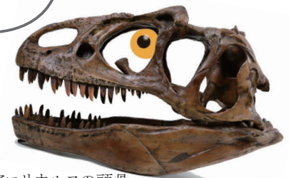
アロサウルスの頭骨

壊れた図書はすぐに修理すれば簡単な補修で済むこともありますが、放っておくと破れた部分が広がったり、外れたページがなくなったりと取り返しのつかないことになります。特に利用頻度の高い子どもの本や、大きな図書、重たい図書などが壊れやすい傾向にあります。もしライブラリーで壊れている本を見つけた時は司書までお知らせください。