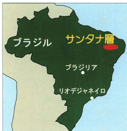
図1 サンタナ層の位置。

メッセル、ホワイトリバー、トゥームディン、モリソン…全部ご存知の方は化石好きですね。実は当館で展示または収蔵している脊椎動物化石標本の世界的に有名な産地（または地層）です。ここではそのような有名な化石産地の一つであるサンタナ層を紹介します。