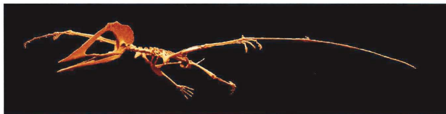
図3 サンタナ層産の翼竜化石。Tupuxuara sp. 翼開長約4m。