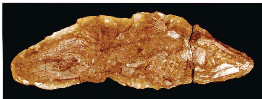
図2 サンタナ層産の魚類化石。Axelerodictys araripensis。全長約112cm。2002年倉田氏より寄贈。

保存の良い化石を産出する地層は、主に石灰質砂岩からなる、海の底に堆積した地層です。化石は石灰質団塊（コンクリーション）の中から産出します。まさに、タイムカプセルの中から取り出すような感覚です。