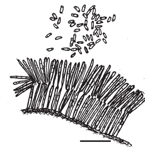
図3. 分生子層断面と分生子. bar: 25 μm.