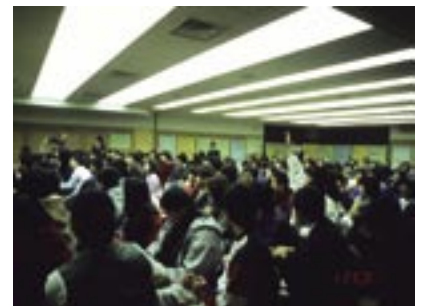
写真7 ワクワクゼミ「博士とクイズバトル」（2001.1 当館）.