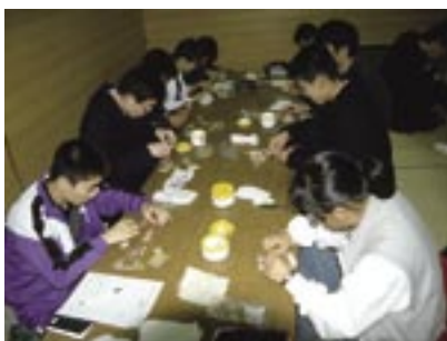
写真4 本間寄木美術館での第15走ミュージアム・リレー（1998.12）。寄木によるコースター製作。