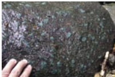
図3 角レキ岩中の緑色の石。

え、大きいものも混じるようになります(図2)。教科書通りです。しかし、期待するほど大きい緑色の石は転がっていません。ましてや緑色の崖などその気配もありません。そこに予想外の岩が登場しました。それは角ばった石(礫)が集まってできた岩(角礫岩)です。そして、その岩の中に緑色の石がぼつぼつと混じっているのです(図3)。当然、この