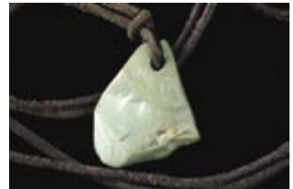
図4 セラドン石の手作りペンダント。

の石が厚さ1mほどの層として挟まっていることを認識し、地層というイメージを持つことになりました。この緑色の石をセラドン石と呼ぶことを知るの、それから数年後のことです。ビクターセンサーで大きな緑色の石のラベルを懐かしくノートにメモをとりました。