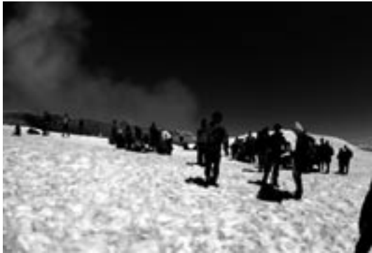
写真1 山頂の登山客たち。大量の火山ガスを背に写真撮影などを行っている。

2004年11月、私は南米チリの保養地、プコン (Pucón) で開催された IAVCEI (国際火山学地球内部化学協会) の総会に出席しました。IAVCEI 総会は4年に一度開催される、火山だけを対象とした研究集会としては世界最大のもので、今回は全世界から936名の参加がありました。私も、研究発表をしに行ったのですが、今回は集会の合間に登ったビジャリカ (Villarrica) 火山のお話です。表紙にも写真とその解説を載せたのでご覧ください。