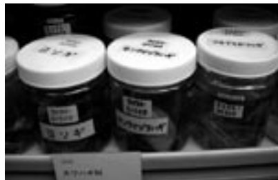
図6 標本を保存する容器には科コードや種コードの他、資料名を蓋と本体の両方に表示する。5050 はカワハギ科、01100 はカワハギ科の中のセンウマヅラハギに割り当てられたコード。容器交換の際に便利のように、貼り替えができる白いビニールテープが使われている。