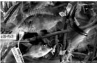
図5 撮影が終わり、ホルマリンによる防腐処理に回った標本たち。固定液の中でアルコール置換と配架を待つ。時間の経過とともに生鮮時の美しい色彩は失われていく。標本に結びつけられた白い布に標本番号が印字されており、番号に対応する学名や産地などの情報はコンピュータによって管理されている。