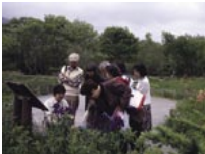
写真2 箱根町立箱根湿生花園での第92走ミュージアム・リレー（2005.5）。