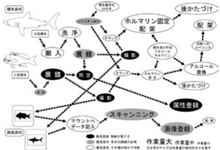
図1 魚類資料の整理の全体像。一連の作業は難易度と作業量に応じてステップ化されている。どのステップも必要不可欠の重要な仕事であり、どこに関わるかはその人の習得した知識や技術による。また、人によって好みが出る場面でもある。

当たり前のことのように、実はこれがなかなか難しいのです。なぜなら、博物館には他にも重要な仕事が山積していることに加えて、何よりも搬入から棚に収めるまでの一連の作業の随所に専門的な知識や技術、さらには長年積み重ねてきた経験やノウハウが必要になるからです。当館には動物、植物、古生物、地球環境などの各グループ合わせて21人の学芸員がいますが、各学芸員の専門分野は細分化しているため、例えば魚類では1人が配属されているに過ぎません。資料整理は高度に専門