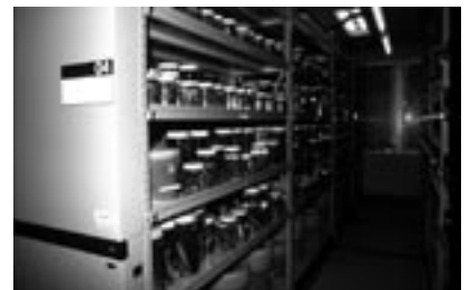
図7 収納効率のよい移動式の棚にコード順に配架された標本。誰でも容易に標本の出し入れができる。液浸標本収蔵庫には空調が効いており、埃もほとんどない清潔な状態に保たれている。半永久的な標本の維持のためだけでなく、ボランティアの方が安心して作業するための重要なファクターでもある。