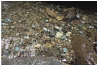
図2 玉川源流にみられる緑色の石。

え、大きいものも混じるようになります(図2)。教科書通りです。しかし、期待するほど大きい緑色の石は転がっていません。ましてや緑色の崖などその気配もありません。そこに予想外の岩が登場しました。それは角ばった石(礫)が集まってできた岩(角礫岩)です。そして、その岩の中に緑色の石がぼつぼつと混じっているのです(図3)。当然、この