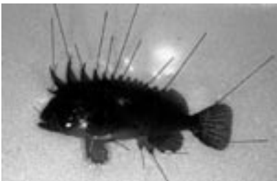
図2 後の研究や展示などに供するため、鮮魚の状態を鱗や体形を虫ピンで整え、固定用ホルマリンで固める。この作業を昆虫の展脚や展翅になぞらえて展鱗と呼んでいる。一人前の展鱗ができるようになるには魚各部の構造についての知識が必要なのはもちろん、技術的に相当な熟練を要する。また、美的センスを問われる場面でもある。

日々続けられています。ところが最近、公立の博物館をとりまく社会情勢は急速に変化しつつあります。独立行政法人化や指定管理者制度化がかまびすしく叫ばれ、不況のあおりを受けてのことは言え、博物館が金食い虫くらいにしか報道されない時代になったことは、資料の維持管理を今後どのようにしていくのかという点で誠に憂うべき事態と言えるでしょう。“公立”博物館から入館者数重視の“効率”博物館への転換はけっこうなことですが、先人たちによって長年積み上げられてきた自然科学の礎が、近視眼的な経済観念にとらわれて我々の時代に潰えることのないようにしたいものです。自然系博物館の使命とは何なのか、今一度基本に立ち返って確認する必要があるのではないのでしょうか?