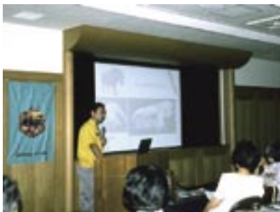
写真3 当館での第95走ミュージアム・リレー（2005.8）。左に掲げられた旗は、江戸具貝街道館長のデザインによる会旗。