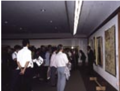
写真1 箱根・芦ノ湖成川美術館での第96走ミュージアム・リレー（2005.9）。