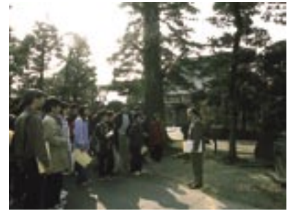
写真5 小田原市尊徳記念館の第77走ミュージアム・リレー（2004.2）. 二宮尊徳の菩提寺を訪ねる。