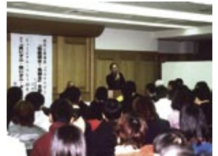
写真6 ワクワクゼミ「地球博士・虫博士を困らせよう」（2001.1 当館）.