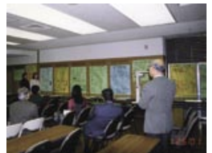
写真8 生徒とミュージアム関係者との対話（2001.1 当館）.