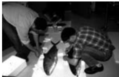
図3 1 cm に満たない小魚も、1 m を超える大型魚も基本的に同じ方法で展鱗する。大きな魚の場合、単に保存液に入れるだけでは固定されるよりも先に腐敗したり、体が曲がってしまったりするため、様々なノウハウが必要となる。大型標本の処理については「自然科学のとびら」第8巻4号を参照。