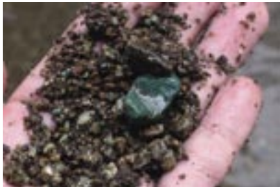
図1 玉川に見られる緑色の石。

身近な教材である石ころから様々な探究を深めることができます。日頃から自然と親しみ、体験を積むことが、新しい知識の理解を助けることや、考えることを始めるきっかけとなるでしょう。私も日常の体験と学校での知識がうまく絡み合い、石ころを材料に自分なりの探究を展開したことがあります。自分の経験を持ち出すことは恐縮ですが、日常の遊びの延長として探究を深めていった「石ころのふるさと探し」の事例を紹介しましょう。