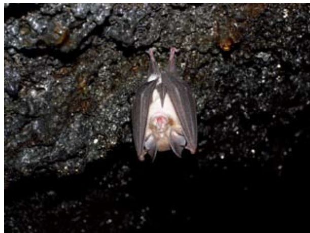
図2 ぶら下がるコキクガシラコウモリ。

コウモリは、昼間は洞穴の天井にぶら下がっているイメージが強いですが(図2)、岩やコンクリート建造物の隙間、樹洞の中や樹皮の隙間、枯れ葉の中などにも潜んでいます。このような昼間の休息場を探し、生息の確認をします。