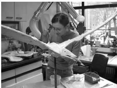
図3 地学標本士のモデルづくり（シュトゥットガルト自然史博物館）。

医学標本士は、特に解剖学、病理学、法医学の分野で活躍していて、病院や研究所などで働いています。博物館で働く生物学、地学標本士とはちょっと違ったタイプの標本士で、医学標本士