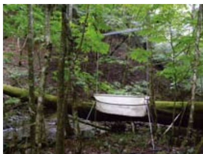
図1 ハーブトラップ。

コウモリのエコーロケーション(反響定位)機能はとても優れているため、カスミ網の存在を察知し、よけてしまうことがよくあります。これに比べて、ハーブトラッ