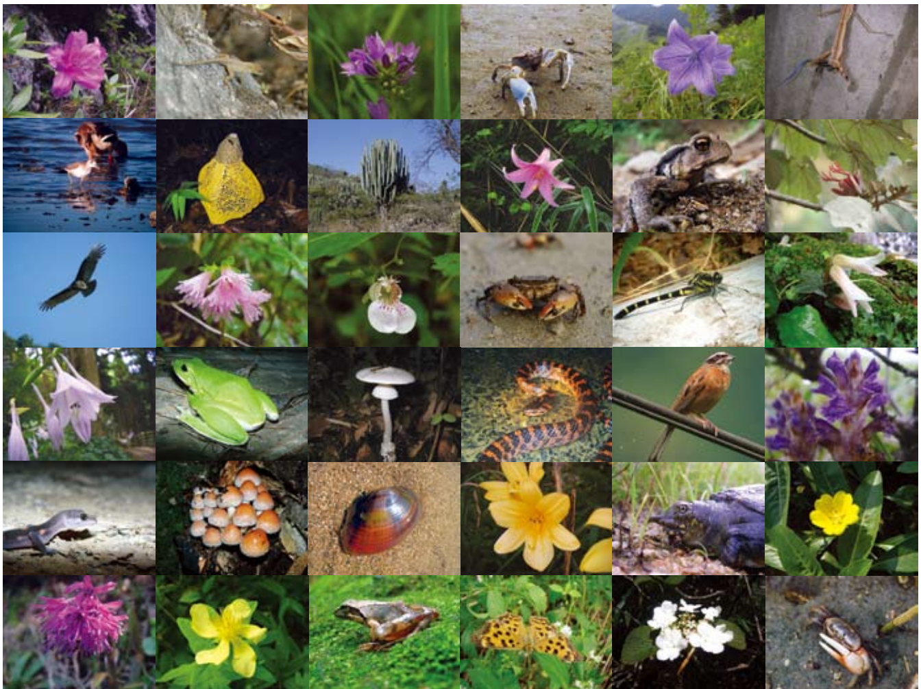
図2 生物多様性は、様々な生物の存在と、生物どうしの関わりによって成り立っています。ほとんどの生物は、他の生物なしには生きられません。しかし、生物どうしの関わりはまだ大部分が未知のままです。 注：これらの写真の生き物は同じところにいるわけではありません。

しています。こうした現状を目にすると、まだそこにいる生物を生き残らせる道を必死で探ることなく、消えてしまったものをどこからか持ってくることに力を注いでしまっただけのようだろうか、と思ってしまう。せめて、何かを復活させようとする間に、多くのものが絶滅していた、というようなことのないように願いたいものです。