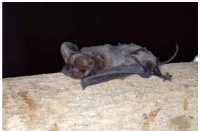
図6 オヒキコウモリ.

もうひとつの主要な休息場所は樹洞です。樹洞ができるような大木は山に行かなければいけないと思いがちですが、実は身近にあります。それは、神社やお寺です。そこには、たいていケヤキなどの大木があり、幹には穴や割れ目がよくできています。このようなところでは、倒れたり折れたりする危険から、太い枝を伐ってしまうので、その切り口から腐り始め、樹洞ができやすくなっているのです。ですから、山の大木よりも街中の大木の方が樹洞ができやすいのかも知れません。