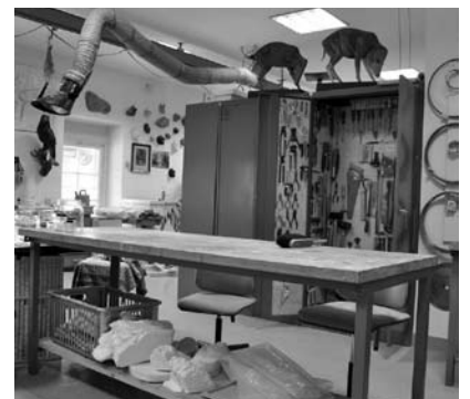
図5 大型標本製作室（シュトゥットガルト自然史博物館）。

もし博物館のバックヤードに来ることがあるようでしたら、ぜひ一度大型標本製作室をのぞいてみてください。ときに解剖をしていたり、ただ解体をしていたり、骨を洗ったり、皮をなめしたり、剥製をつくったりしています。いつ行くにおうか、とははっきり言えませんが、それも含めて、どういう過程を踏んで標本が出来上がっていくのかを感じてもらえるのではないかと思います。