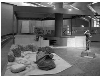
図4 常設展変更作業中（シュトゥットガルト自然史博物館）。