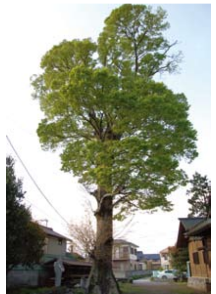
図8 ヤマコウモリが利用するケヤキ.

これまでの調査で、ある程度は神奈川県のコウモリの生息状況がわかってきましたが、三浦半島や県北部など、まだよく調べられていない地域があります。まだ県内からは知られていないコウモリが2～3種は見つかる可能性があります。神奈川における生息状況を解明するために、これからも調査を続けていこうと考えています。