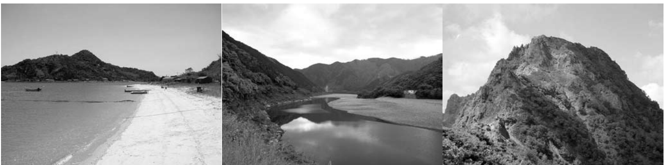
図1 海、川、山、どこにもありそうな風景でも、そこにすむ生き物は場所ごとにさまざまです。左 海:白石島(岡山県)、中央 川:四万十川(高知県)、右 山:八ヶ岳(長野県)。

生物多様性への理解が進むことは、野生生物を研究対象としている者の一人として、喜ばしいことだと考えています。しかし、最近の社会の動きを見てみると、懸念されることもいくつかあります。特に気になるのは、豊かな自然環境を存続させることに力が注がれていないのではないか？ということ。例えば、国内では一度消えてしまったトキやコウノトリを復活させようという自然再生事業が積極的に行われています。トキやコウノトリは、かつて我が国の農村環境を主な生息場所としていた鳥です。これらの事業は、生物多様性に興味を持ってもらう上で非常に効果的で、実際ここ数年の間、社会に生物多様性の理解が進んでいる原動力となっているのは事実でしょう。ただ、トキやコウノトリをマスコットにした自然再生事業が注目されている一方で、希少野生動物が数多く生息する地域が様々な要因で脅かされており、そのような地域の生物多様性は待たなしで確実に消失しようと