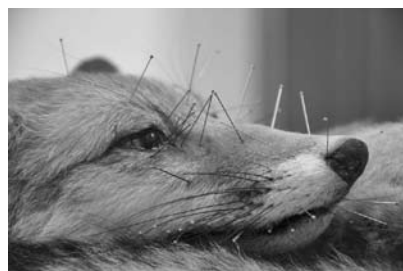
図1 完成間際のキツネの標本（シュトゥットガルト自然史博物館）。

いう分野を専門に担当しているように、標本土は自然資料の標本化とその管理、保守を担当します。最近では、再入手が困難な種の標本や非常に古い標本の修理や修復を、研究標本の現状維持という目的だけでなく、文化財保存と同じような意味合いで行う機会も増えてきています。