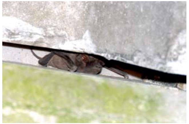
図5 コンクリートの隙間に潜むオヒキコウモリ.