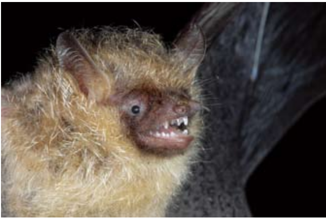
図3 テングコウモリ.