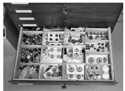
図2 剥製用の義眼。大きささまざま、色もいろいろ（シュトゥットガルト自然史博物館）。

生物学標本土の仕事の内容は剥製師と重なる部分が多く、基本的に同じです。それでは違いはどこか、といわれると困るのですが、強いて言えば博物館で働く標本土は研究標本や、剥製以外の標