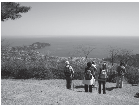
湯河原の城山からの眺め(湯河原市街地から真鶴半島)