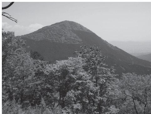
箱根より古い火山のマグマが露出する南足柄 矢倉岳