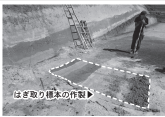
はぎ取り標本の作製▶