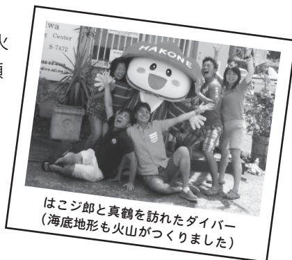
はこじ郎と真鶴を訪れたダイバー(海底地形も火山がっくりました)

活動を続ける箱根火山と私たちが、これからも「持続可能な関係を維持する」(今回の展示ではこれを「友だちになる」と表現しました)には、箱根火山を知ることが必要です。箱根ジオパークを通して箱根火山のことをもっと知りましょう。