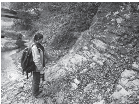
マグマの通路が間近に見える須雲川