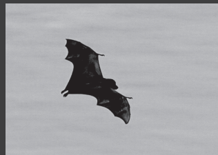
左から：イオウジマミノガイ属、南硫黄島周辺のギンガメアジ、アカオネツタイチョウ、ミナミイオウヒメカタゾウムシ、オガサワラオオコウモリ

当館では新型コロナウイルス感染症の拡大を防止し、来館者の皆さまの安全確保に努めるため、感染症拡大予防対策を実施しています。感染拡大状況により、臨時休館や来館予約制による入館制限を実施している場合もあります。各種の制限により、ご不便をお掛けすることになります。何卒、ご理解とご協力をお願いいたします。