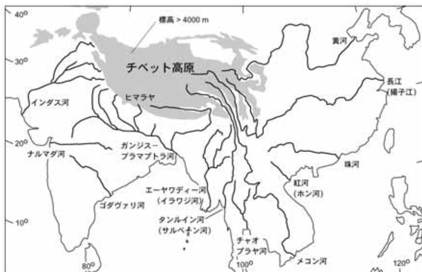
図 .アジアの代表的な河川とヒマラヤ・チベット高原

ところが、近年河川は大きく変容してきており、黄河では現在運搬する土砂量は、以前の10分の1以下にまで減少しており、日本の1級河川よりも少ない水量しか運んでいません。また、タイのチャオプラヤ河三角州では、地下水の汲み上げによって地盤沈下が起こり、相対的に海水準が上昇したことにより、海岸線が700mも後退しています。今後はこれらの変化に、地球温暖化による海面上昇が海域から三角州に影響を及ぼそうとしています。