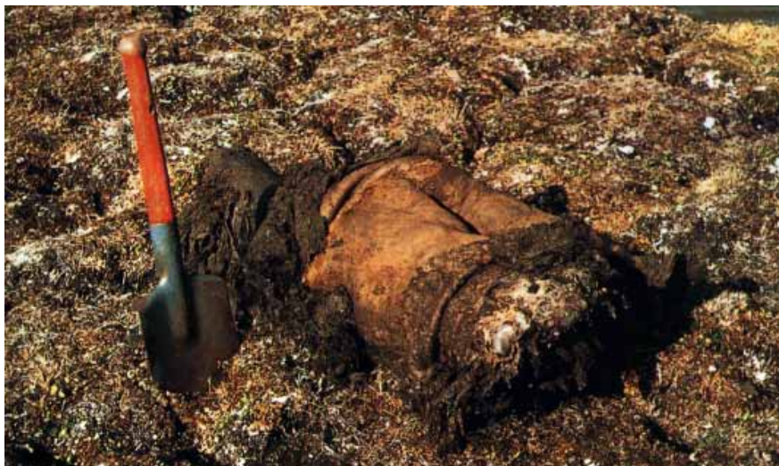
図.新シベリア諸島大リヤホフスキー島で永久凍土中から凍結状態で掘り出されたマンモスの脚

温暖化のもとで北極海沿岸でも永久凍土が融解し、そこに埋蔵されていたマンモスの遺体が凍結した状態で現れてきました。凍結状態のままのマンモスがまもなく愛知万博で展示される予定です。極北シベリアでは約1万年前に忽然とマンモスがいなくなりました。永久凍土に残された様々な情報から、マンモス絶滅の謎が解きあかされつつあります。また凍結したマンモスの遺伝子情報からマンモスを復元するという計画も進められています。