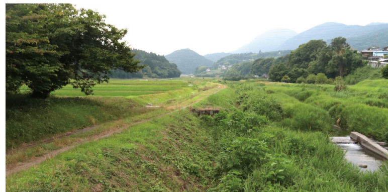
G.アカギツネ/H.タヌキ/I.クロウ/ J.キビタキ