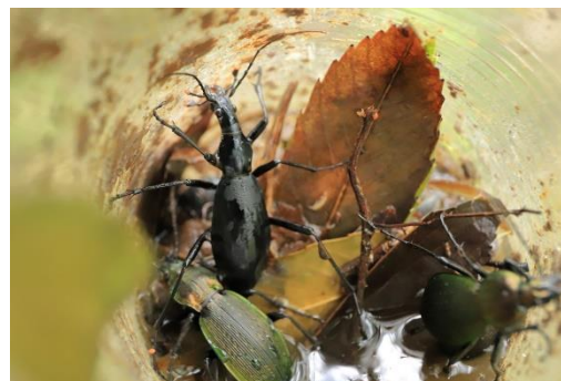
ヒメマイマイカブリ