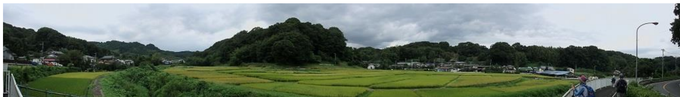
2019年度観察会 足柄上郡中井町の里山風景