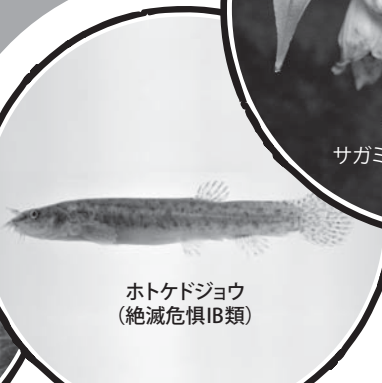
ホトケドジョウ (絶滅危惧IB類)