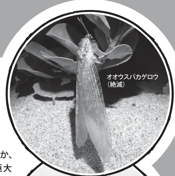
オオウスバカゲロウ (絶滅)

レッドデータとは動植物の生息状況を調査し、絶滅のおそれがある種についての情報をまとめたものです。当館では、他県に先駆けて1995年に動植物のレッドデータブックを出版しました。生き物を取り巻く環境が刻一刻と変化し続けているなか、2006年には改訂版が出版され、現在2回目の改訂に向けた準備が進められています。