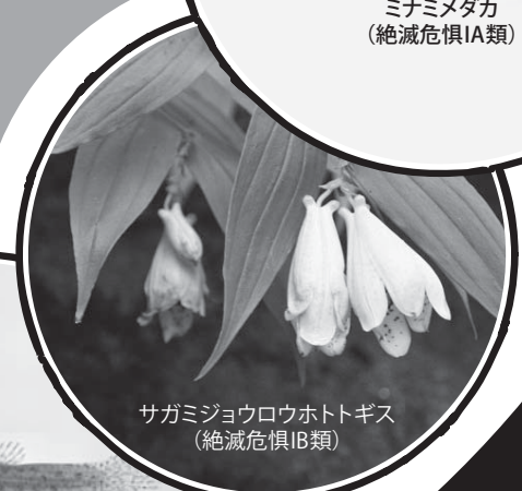
サガミジョウロウホトトギス (絶滅危惧IB類)