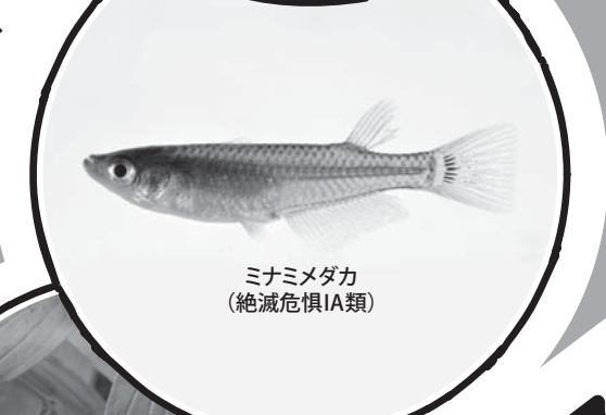
ミナミメダカ (絶滅危惧IA類)