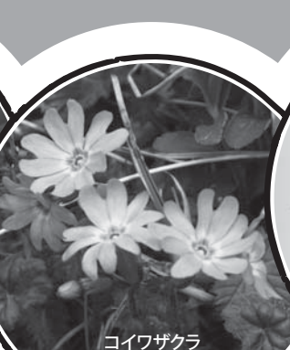
コイワザクラ (絶滅危惧II類)