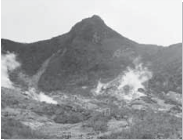
大涌谷と冠ヶ岳 箱根町

A. 公的機関・地域社会および民間団体が加盟した箱根ジオパーク推進協議会が平成23年5月に設立されました。ジオサイトを決定し、ガイドツアーの研修、試行的なツアーもスタートしています。この企画展・巡回展も箱根ジオパーク認定に向けた普及活動の1つです。またホームページもあります。 ( http://www.hakone-geopark.jp/ )