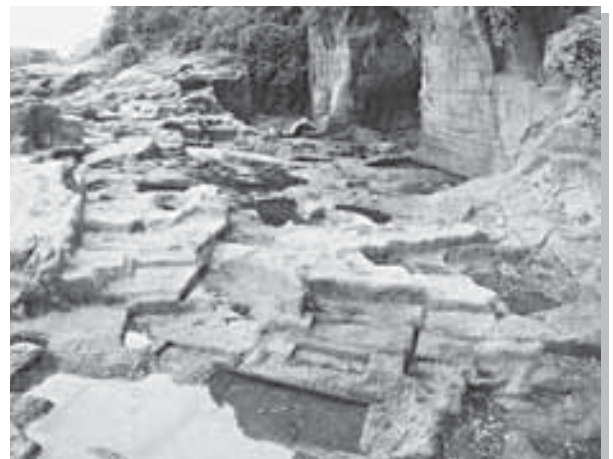
番場浦採石場跡 真鶴町

A. 箱根火山は世界的に有名な火山です。豊かな自然と歴史もあることから、まさにジオパークにふさわしい地域と言えます。現在、箱根町、小田原市、真鶴町、湯河原町及び神奈川県では平成24年度の日本ジオパーク認定をめざした取り組みを行っています。