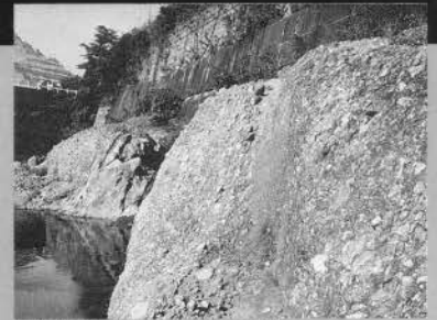
足柄層群の礫岩層（酒匂川上流）