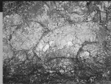
枕状溶岩（東丹沢早戸川上流）