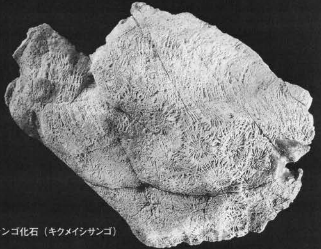
丹沢産サンゴ化石（キクメイシサンゴ）

神奈川県は、太平洋から見ると南北に延びる伊豆・小笠原弧の北端部にあります。丹沢山地や伊豆半島の地塊は、伊豆・小笠原弧の海で生まれ、フィリピン海プレートに乗って北へ移動し、本州側の島弧の中央部に衝突し、本州側に食い込んでいます。また三浦半島から房総半島にかけては、フィリピン海プレートの海底の堆積物が陸側に押し上げられてきています。このように伊豆・小笠原弧の海から生まれ衝突し付け加わり、地殻変動が激しく、活断層があり、火山が活動する神奈川県を紹介します。