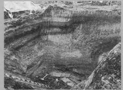
武山断層（横須賀市長沢）