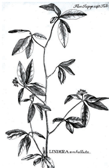
図1 ツェンペリー Flora Japonica のクロモジ。

ペリーが来航し、鎖国が解けると、開港地横浜から近い箱根には多くの外国人研究者が訪れ、やがて、明治時代になると日本人による、自然史研究のフィールドにもなりました。特に植物では、箱根ではじめて採集され基準産地になったものが多くあり、学名や和名に箱根の名のつくものもたくさんあります。